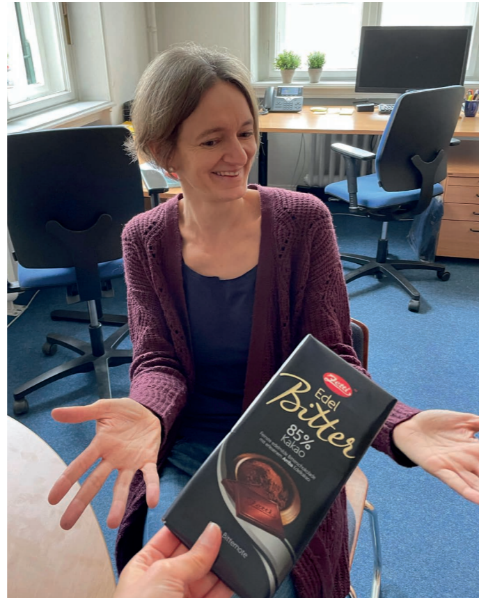
3. Womit können Studierende Sie am besten bestechen?