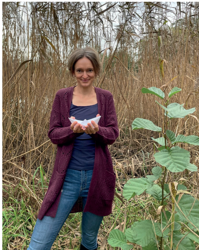
2. Was sollte man in Berlin unbedingt gemacht haben?