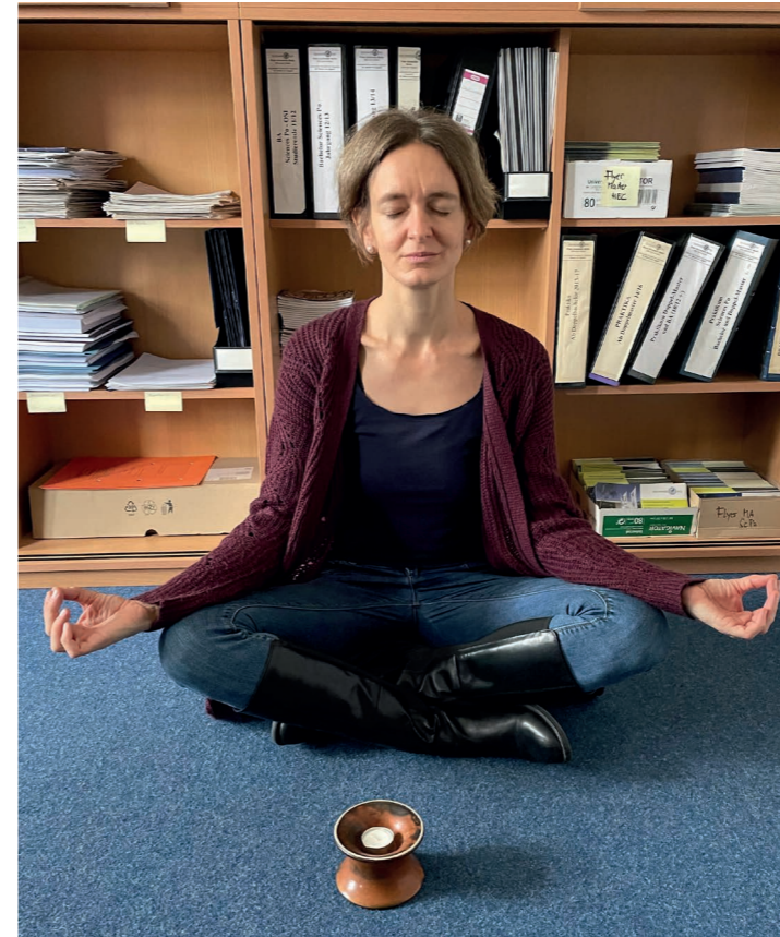
7. Wie ist ein Mensch, der das komplette Gegenteil von Ihnen darstellt?