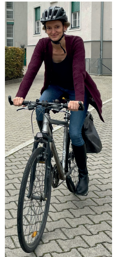
6. Ihre Lieblingsaktivität am Wochenende?